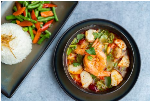
3 TOM YUM GOONG + STIR FRIED BEANS & OYSTER SAUCE 200 Spicy soup with prawns, steamed rice or steamed vegetables ต้มยำกุ้ง + ผัดถั้วฝักยาวน้ำมันหอยเสิร์ฟพร้อมข้าวสวย