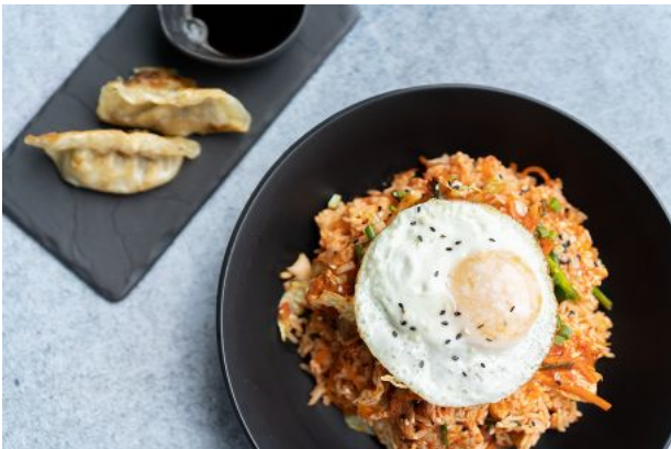
9 KIMCHI FRIED RICE WITH PORK OR CHICKEN + VEGETABLE GYOZA 180 Fried rice with kimchi, pork or chicken, fried egg ข้าวผัดกิมจิ (หมู, ไก่) ไข่ดาว + เกี้ยวซ่า