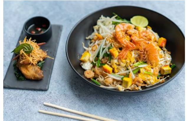
2 PHAD THAI GOONG + CRISPY CHICKEN WINGS 200 Phad Thai with shrimp, chives, peanuts, chili flakes ผัดไทยกุ้งสด + ปีกไก่ทอด