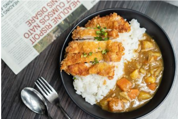
13 CHICKEN KATSU CURRY 180 Cutlet chicken, Japanese rice, curry with carrot and potato ข้าวหน้าแกงกะหรี่ไก่ทอด

ORDER NOW | Available daily during 11 a.m. - 9 p.m.