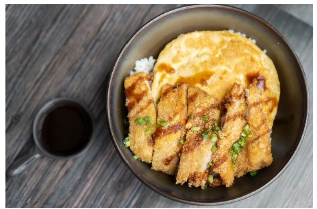
12 PORK KATSU DON 180 Cutlet pork, Japanese rice, fried omelet, katsu sauce ข้าวหน้าหมูชุบแป้งทอด (คัตสึด้ง)