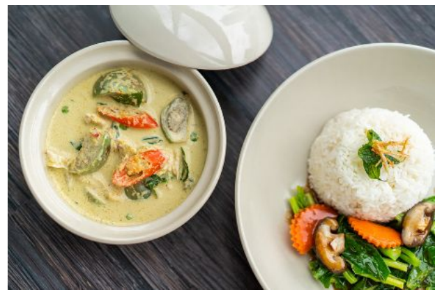
6 GREEN CHICKEN CURRY + STIR FRIED KALE 180 Served with steamed rice แกงเขียวหวานไก่ + คะน้าน้ำมันหอยเสิร์ฟพร้อมข้าวสวย