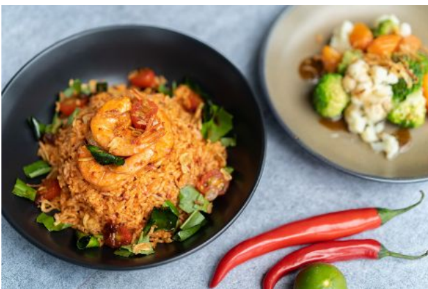
11 TOM YUM FRIED RICE WITH PRAWNS + STIR FRIED VEGETABLES 200 Stir fried tom yum flavored rice and prawns ข้าวผัดต้มยำกุ้ง + ผัดผักรวม