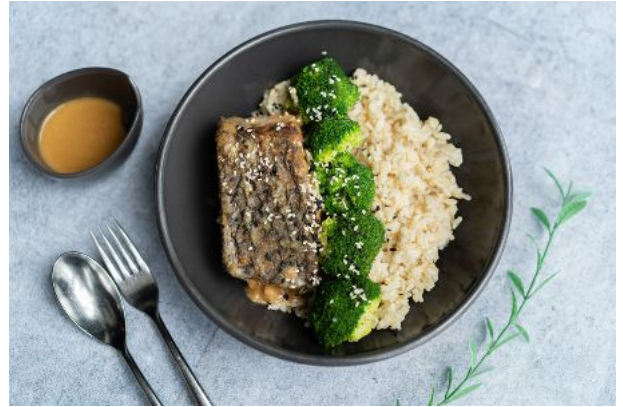
14 MISO SEABASS 200 Sea bass, miso sauce, steamed broccoli, Japanese rice ข้าวหน้าปลาทะเลผัดซอสมิโซะ