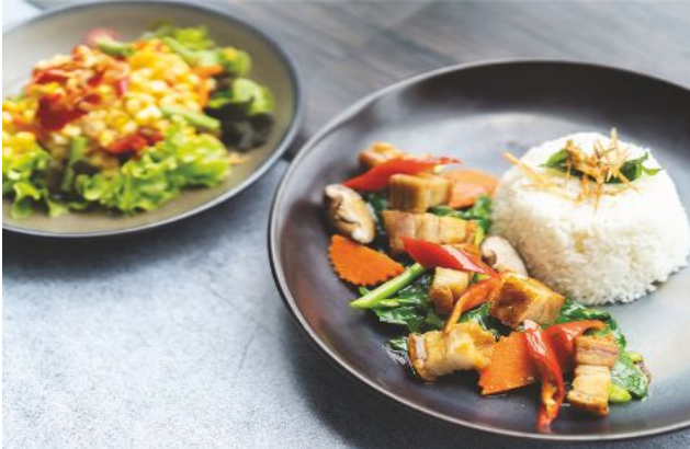
7 STIR FRIED KALE WITH CRISPY PORK BELLY + KHAO POD SALAD 180 Served with steamed rice ข้าวคะน้าหมูกรอบ + ต่ำข้าวโพด

ORDER NOW | Available daily during 11 a.m. - 9 p.m.