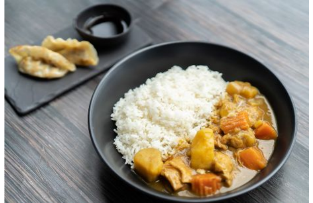
8 JAPANESE CHICKEN CURRY + VEGETABLE GYOZA 180 Japanese chicken curry, potato, carrot, steamed rice แกงกะหรี่ไก่ญี่ปุ่น + เกี้ยวซ่าผัก