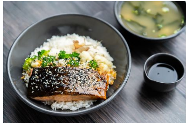
4 GRILLED TERIYAKI SALMON + MISO SOUP 200 Salmon, teriyaki sauce, steamed rice or steamed vegetables ข้าวหน้าปลาแซลมอนย่างเทริยากิ + ซุปมิโซะ