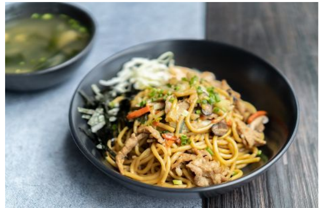
10 YAKI SOBA NOODLES + MISO SOUP 180 Yaki soba noodle, pork or chicken, in a special sauce ยากิโซบะ (หมูหรือไก่) + ซุปมิโซะ