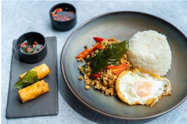
1 PHAD KA PRAO + SPRING ROLLS 180 Stir fried pork or chicken with chili, basil, garlic, steamed rice, fried egg ข้าวกะเพราไข่ดาว (หมูหรือไก่) + ปอเปี๊ยะทอด

ORDER NOW | Available daily during 11 a.m. - 9 p.m.