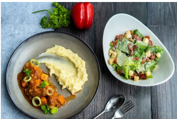
5 LAMB STEW + CAESAR SALAD 🍷 220 Served with mash potato สเตวแกะเสิร์ฟพร้อมมันบด + ซีซาร์สลัด